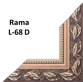
Rama L-68 D