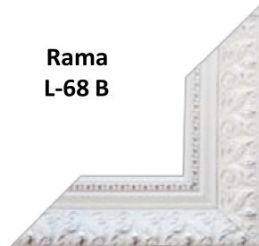
Rama L-68 B