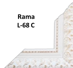
Rama L-68 C