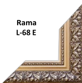
Rama L-68 E