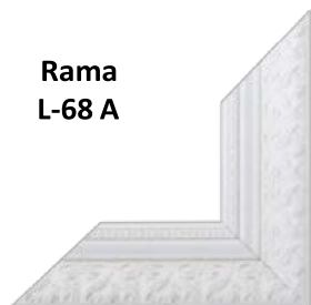
Rama L-68 A